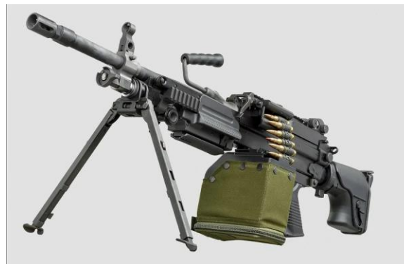
Kulomet Minimi MK3

Kulomet Mk3 společnosti FN Herstal má ergonomickou pažbu. Minimi má navíc optické nástavce, které maximalizují přesnost a účinnost střelby i v prostředí se slabým osvětlením. Na rozdíl od stárnoucích KSP-58 může Mk3 obsluhovat pouze jedna osoba.