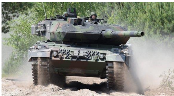
Leopard 2A7 / KMW

Ariete je italský národní projekt zrozený v 80. letech minulého století (tank byl poprvé představen v roce 1987). Armáda plánovala pořídit 300 kusů, ale konec studené války a následné škrty v obranných rozpočtech akvizici odložily o deset let a došlo k objednávce pouze 200 tanků.