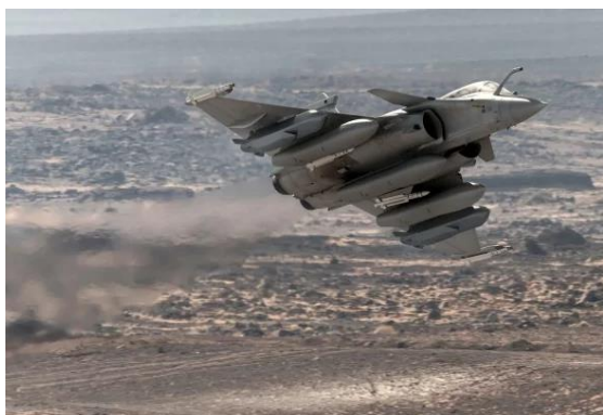
Rafale F4 nesoucí dvě střely s plochou dráhou letu SCALP

V prosinci minulého roku uzavřela francouzská firma Dassault Aviation dohodu s německým Airbus Defence & Space o společném vývoji a stavbě letuschopných technologických demonstrátorů NGF – první demonstrátor vzletne v roce 2029. Následně se rozhodne o dalším vývoji. Ten případně povede ke stavbě prototypů a k zahájení sériové výroby NGF. Podle současných plánů NGF vstoupí do výzbroje nejdříve v roce 2040.