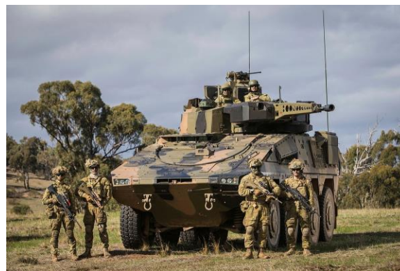
Australské bojové průzkumné vozidlo Boxer

Verze Boxer pro boj s pěchotou a bojový průzkum jsou vybaveny 30milimetrovým automatickým kanónem a budou vybaveny protitankovými raketovými systémy Rafael Spike LR2.