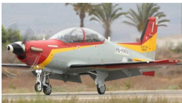
Cvičný letoun PC-21

Objednávka 16 letounů PC-21 doplňuje 24 letounů, které byly pořízeny počátkem roku 2020 a z nichž poslední byl Španělsku dodán v polovině roku 2022. Kromě letounů jsou součástí obchodu také simulátory a další příslušenství. Španělsko je tak nyní největší provozovatel letounů PC-21 v Evropě.