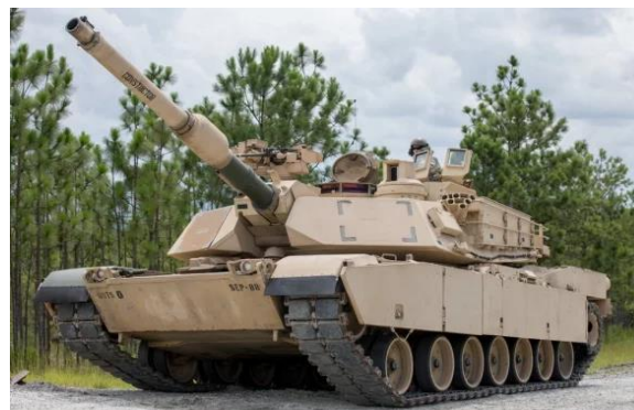
M1A2 Abrams

Další budoucí objednávky Abramsů jsou pravděpodobné, neboť rumunská armáda má pět tankových praporů.