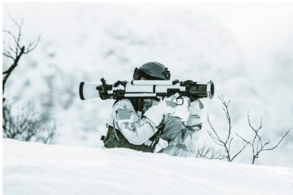
84 mm Carl-Gustaf M4

střeliva. Dodávky munice do Litvy budou zahájeny v průběhu roku 2024.