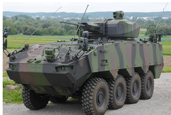
Věž UT30 MK2

Smlouva, kterou uzavřela společnost General Dynamics European Land Systems, se týká výroby věží UT30 MK2 a minometných systémů SPEAR, které budou integrovány do rumunského obrněného transportéru Piranha V. Zahrnuje také dálkově ovládané zbraňové stanice, které poskytují střelci dodatečnou ochranu.