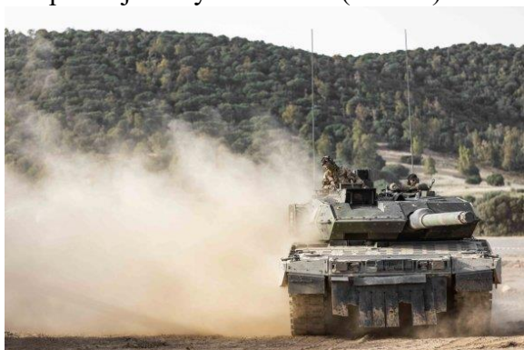
Německý Leopard 2 A7V na cvičení Noble Jump 23

Dodací lhůty u Leopardů a Abramsů jsou čtyři až šest let. Navíc metoda nákupu Abramsů a Leopardů má být jednodušší a rychlejší než K2. Německý a americký tank stojí podobně, ale náklady na údržbu Leopardů jsou výrazně nižší (o 50 %).