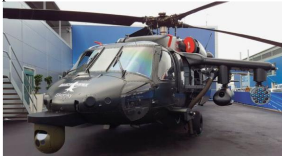
Ozbrojený Black Hawk

ozbrojené síly země zvažují objednávku přibližně 32 vrtulníků.