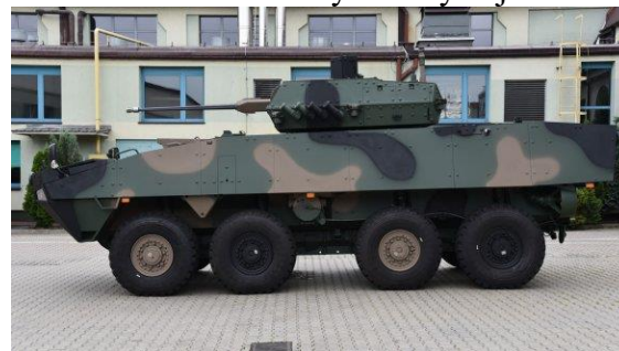
Rosomak-L s bojovým modulem ZSSW-30

Nově objednané Rosomaky nahradí u vybraných jednotek zastaralé BVP-1 nebo zamíří do zcela nově vytvořených jednotek.