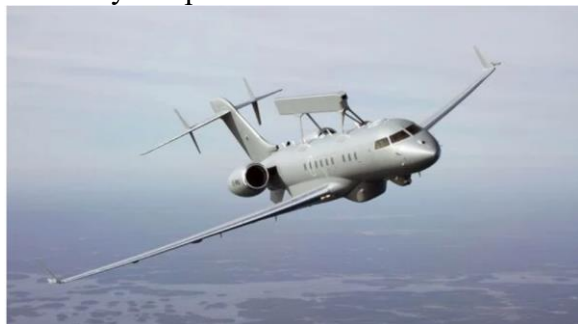
Letoun GlobalEye AEW&C

Zpráva o dodávce přišla 13 měsíců poté, co švédská vláda v červnu 2022 uzavřela smlouvu se Saabem na dodávku dvou letadel GlobalEye s opcí na dvě další.