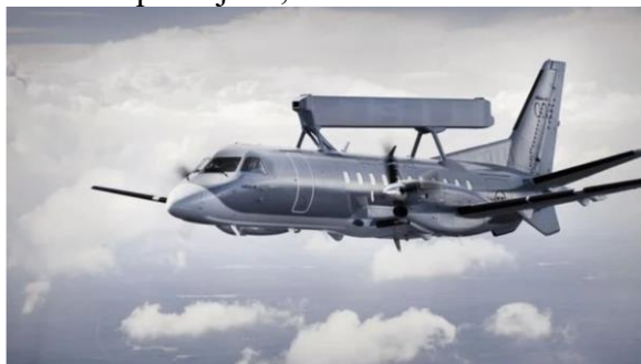
Letoun Saab 340 AEW&C

„Polský úřad pro vyzbrojování dnes podepsal smlouvu na dodávku švédských letounů Saab 340. V důsledku toho bude východní křídlo NATO posíleno a polský vzdušný prostor se stane bezpečnějším,“ řekl Błaszczak.