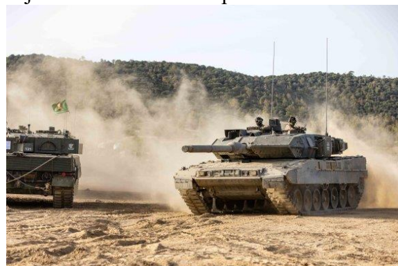
Německý tank Leopard 2 A7V na cvičení Noble Jump 2023 v italské Sardinii

Nákup Leopardů 2A8 a modernizace Ariete je však v Itálii vnímáno jako přechodné řešení. Cílem Říma zůstává účast na francouzsko-německém programu MGCS (Main Ground Combat System). O MGCS se zajímá také Švédsko a Španělsko.