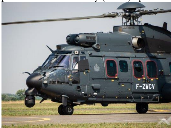
Maďarský H225M Caracal

V budoucnu je plánovaná integrace protitankové řízené střely (PTŘS) Spike.