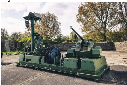
Terrahawk Paladin / MSI-Defence Systems

Ukrajina potřebuje masově vyrobitelné a nasaditelné prostředky PVO schopné velmi levného ničení malých vzdušných cílů, zejména dronů.