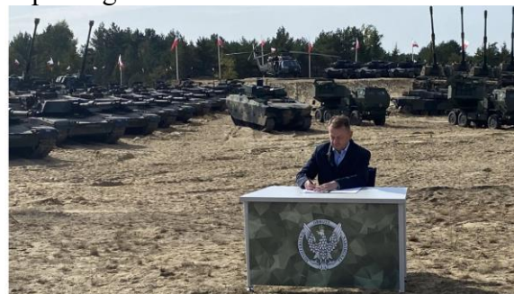
Polský ministr obrany Mariusz Blaszczak podepisuje nové smlouvy před stávajícími obrněnými vozidly.

Budou používána na vyšších stupních velení, např. brigád a dále.