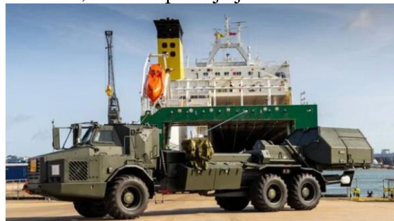
Archer 6×6 SPH

Organizace Defence Equipment & Support (DE&S) britského ministerstva obrany, která dodává Archery britské armádě, provede testy a zkoušky první dodané samohybné houfnice, která se použije jako referenční.