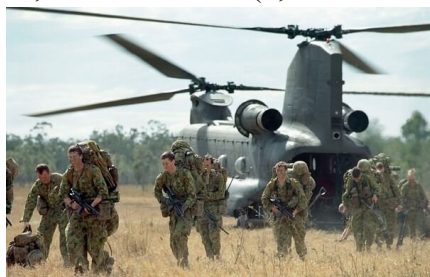
Vojáci Královského australského regimentu vysazeni z vrtulníku CH-47F Chinook

DoD dodalo, že australský obranný průmysl bude i nadále hrát „klíčovou roli v podpoře rozšířené flotily Chinook“. S tím souvisí předpokládané další investice do australské ekonomiky v příštích 20-ti letech ve výši 69,5 milionu AUD (1,126 mld. Kč).