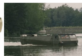
Transportér KAPA při zkouškách